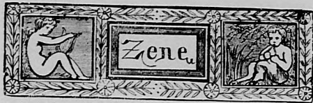
1885-iki ORSZÁGOS KIÁLLÍTÁS XX-ik (ZENE) CSOPORTJA.

vállalat élére állt. „Revue internationale“ az új folyóirat neve, mely minden hó 10-én és 25-én jelen meg a két művelt világrész minden nemzetének irodalmi képviselőjének munkáival. Az essay és novella valamint a correspondencia képezi a lap főtartalmát míhez még a nemzetközi irodalom áttekintése objektív és pártatlan előadásban járul.