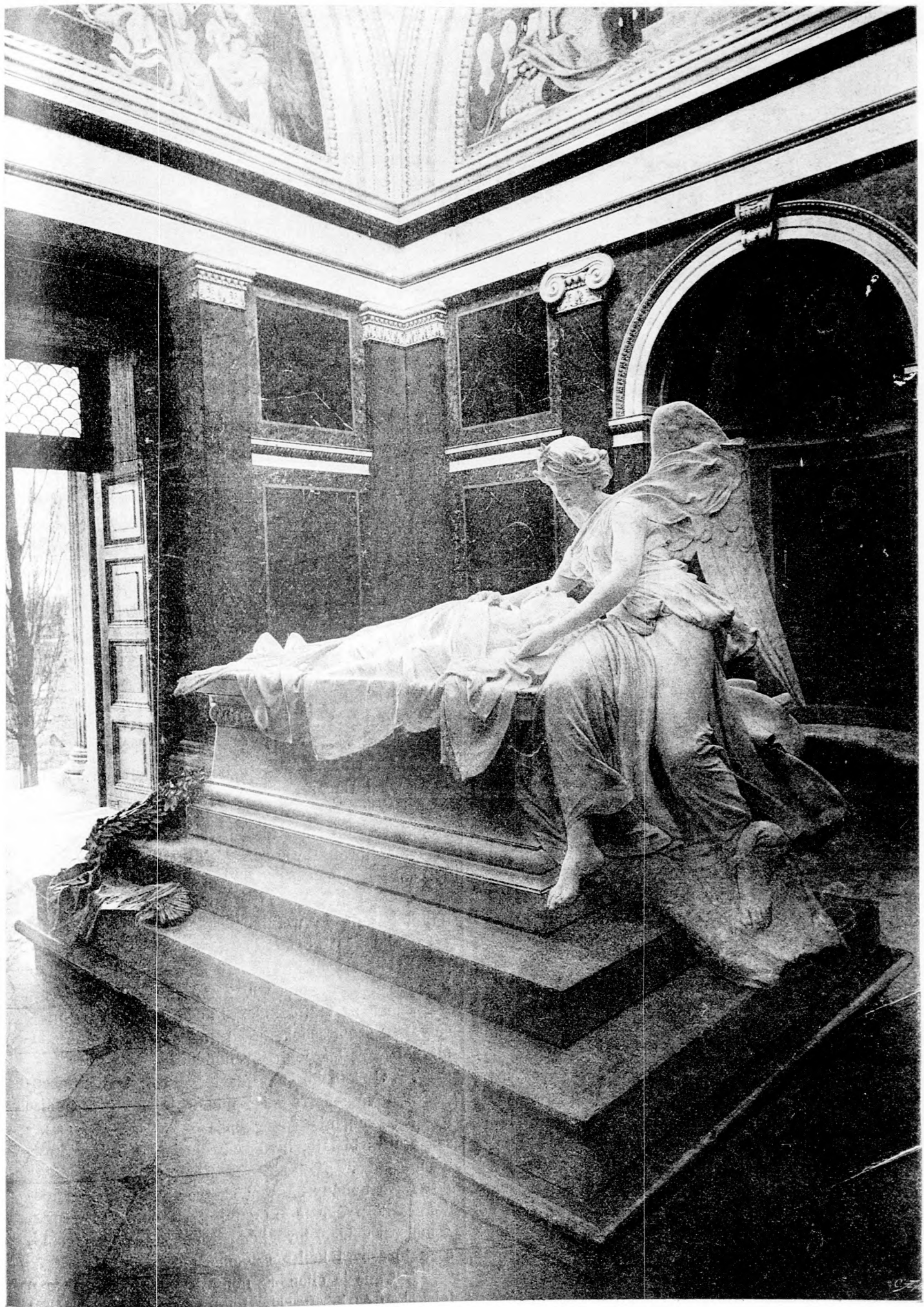
Deák Ferencz sírboltja.