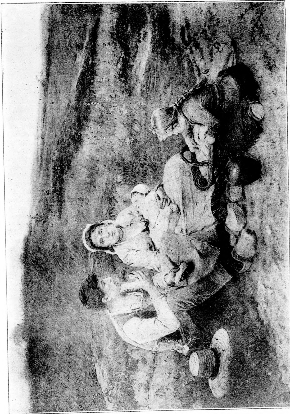
Ebéd a szérűn.