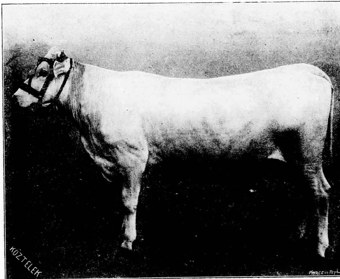
Purgi 5 éves borzderes tehén.

1. Hogy a gabonasziszik a magtárban el ne szaporodhassék, szükséges, hogy a magtár mindig tisztán tartassék. Ez okból fel kell használni minden alkalmat, hogy valahányszor a magtár kiürül, annak összes zugai (lépcsőaljja, falburkolat belseje, vakablak, támasztó oszlop alja, a padló-és falburkolat repedései, a mestergerendák) kisöpörtessenek, minden maghulladék szemetetstől onnan kitakarítassék; általában vigyázni kell, hogy a magtár e