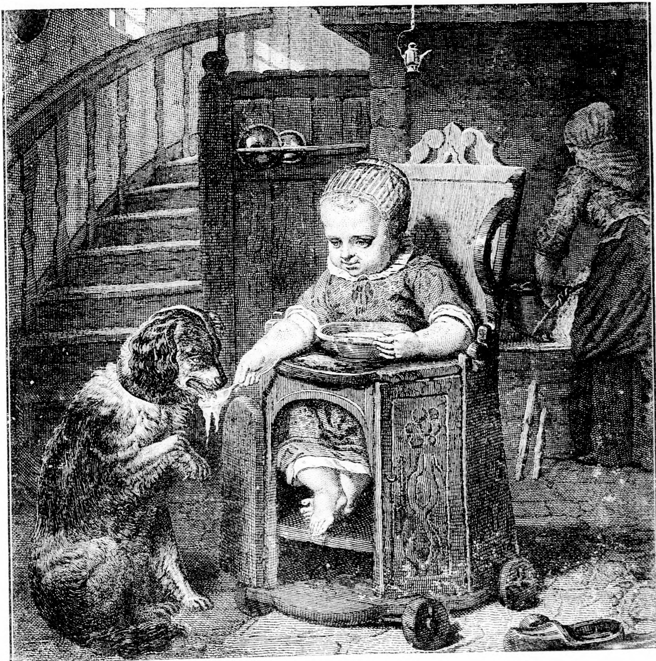
A jó pajtások.

A gyászos nap történetét azonban egészen új világitásban mutatja be egy akkortájt Magyarországon járt magasrangú tiszt.