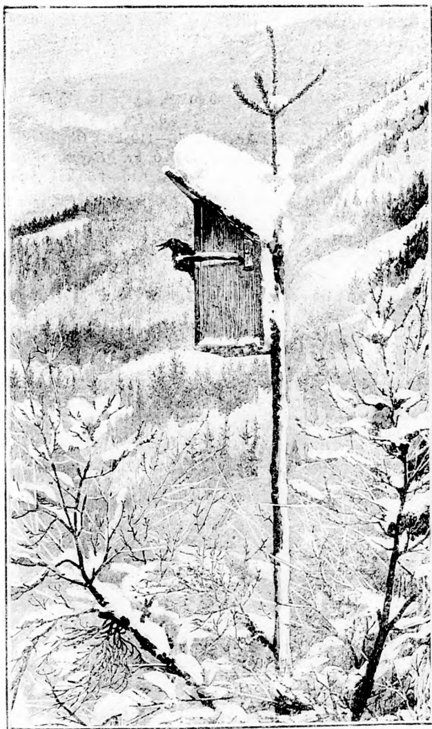
Tél az erdőben.

Tél az erdőben. Amikor télapó megrázza szürke kopott subáját és fehér lepellel borít be erdőt mezőt, szigorú idők járnak az erdőnek itt szorult dalosaira, madaraira. Meghúzódnak a szegény párák a fagalyak között összetákolt fészkeikben s valami nagy fáradságukba kerül nekik a mindennapi élelem megszerzése. A zuzmarás, havas fagalyak repedéseiben fölkatatják a hernyópetéket s ugyszólván az az eledelük . . . A jótékony emberek sok helyen gondoskodnak a télen didergő szárnyasok részére meleg enyhelyről mai képünk is ilyen erdőrésztet ábrázol, hol a tél madarait szánó emberi kéz alkotta téli lakóhely van a fagalyra fölállítva a tél mostoha gyermekei számára.