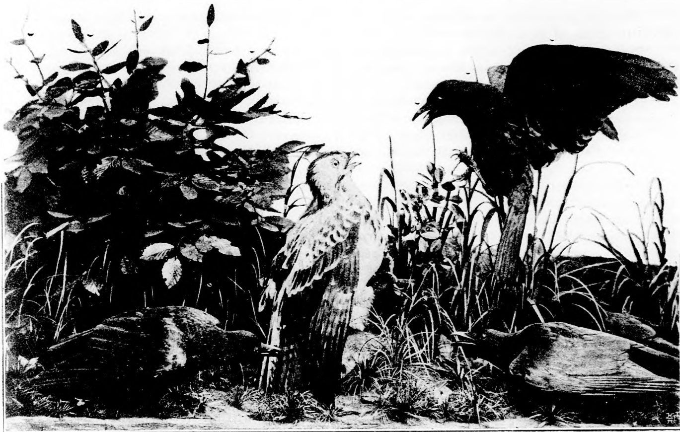
Vércse és varjak.

zatos mosolyokat engedjenek meg maguknak. Tiltakozom minden illetlen feltevés ellen 4 .