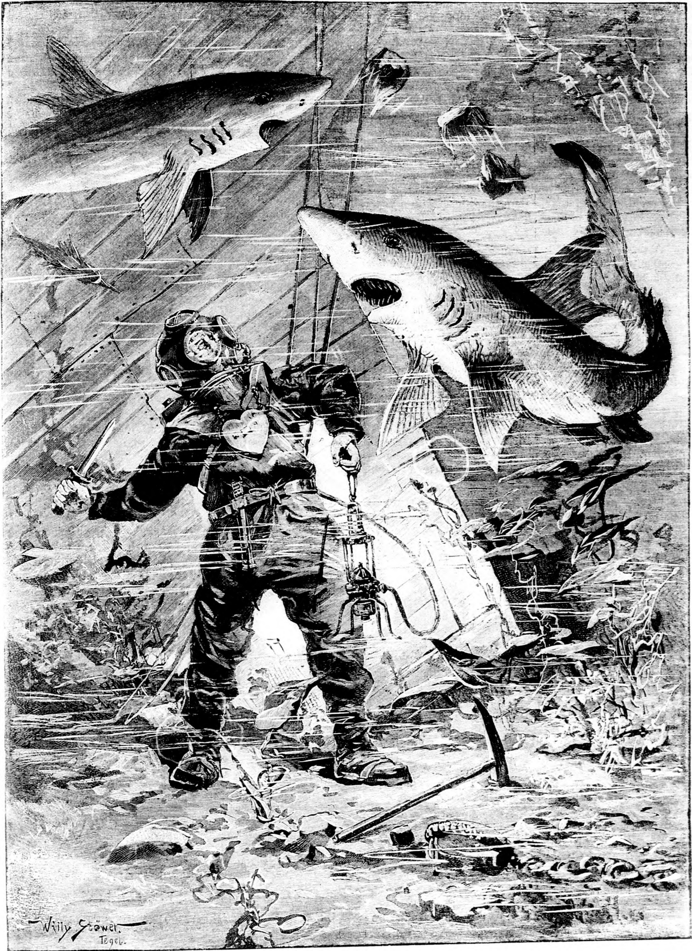
A BUVÁR HARCZA A CZÁPÁKKAL.