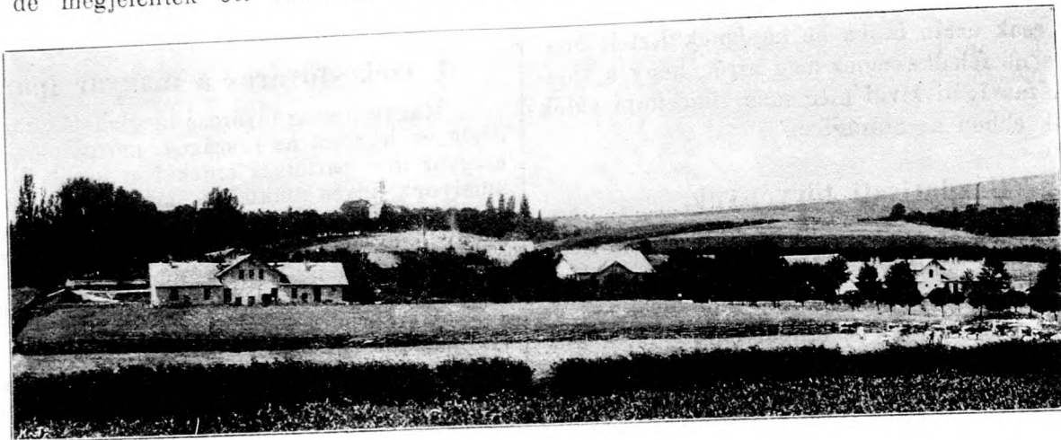
A kassai m. kir. gazd. tanintézet majorgja.

köszönte Kassa városának az intézet érdekében hozott áldozatait. Bizony nem veszték azok kárba. Több ezer fiatal embert adott át már az intézet a közéletnek, akik az édes magyar föld rögeit munkálva, tényezőivé váltak a nemzet gazdasági haladásának. Megható volt, mikor az intézet legelső növendéke lépett emelvényre, az élet delén levő férfiu s meg-