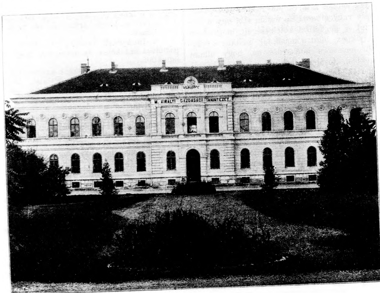
A kassai m. kir. gazd. tanintézet főépülete.