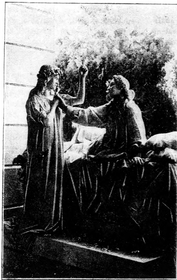
„OTT FENN TALÁLKOZUNK.“

Ugy szoptatásnál, mint itatásnál annyi tejet adjunk a borjunak, amennyit önszántából jóízűen meginni képes. Tulsok tej azonban könnyen meg is érthet neki, azért jó lesz tudnunk azt, hogy pl. a