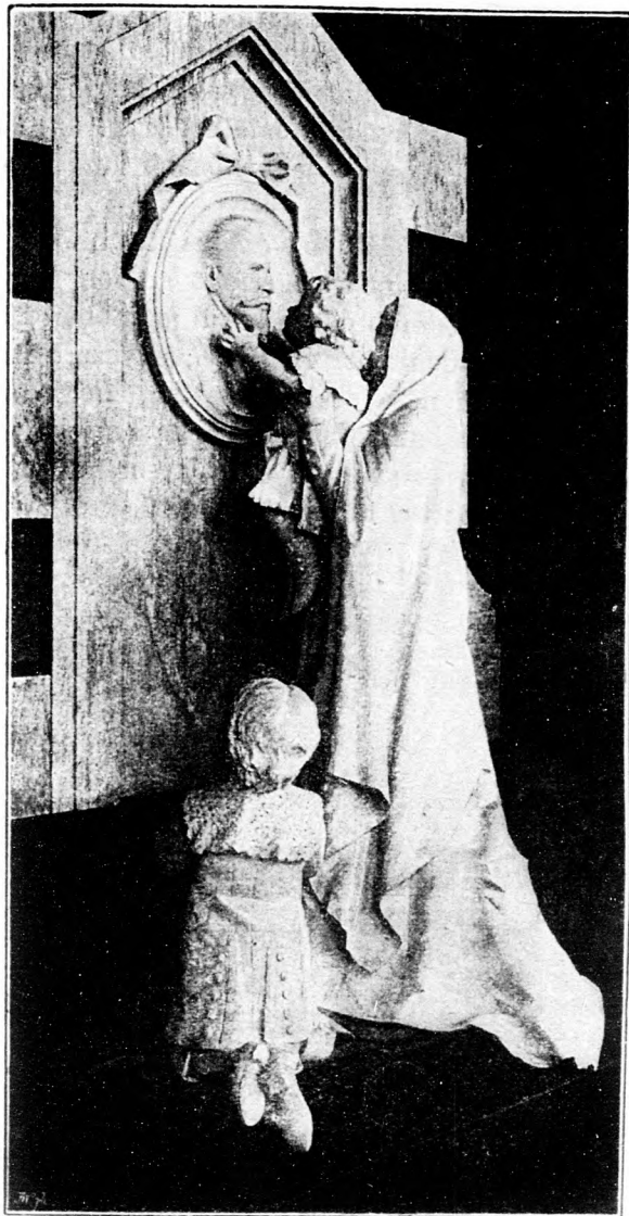
AZ ATYA SIRJÁNÁL.

Szegény jó öreg! Mit tudja ő, hogy micsoda unezlányi csekélység az ő nagy baja tengersok másé mellett s hogy a hatalmas császár egy tapodtat sem tehetne a maga utján, ha minden kis ember gondját a vállára venné.