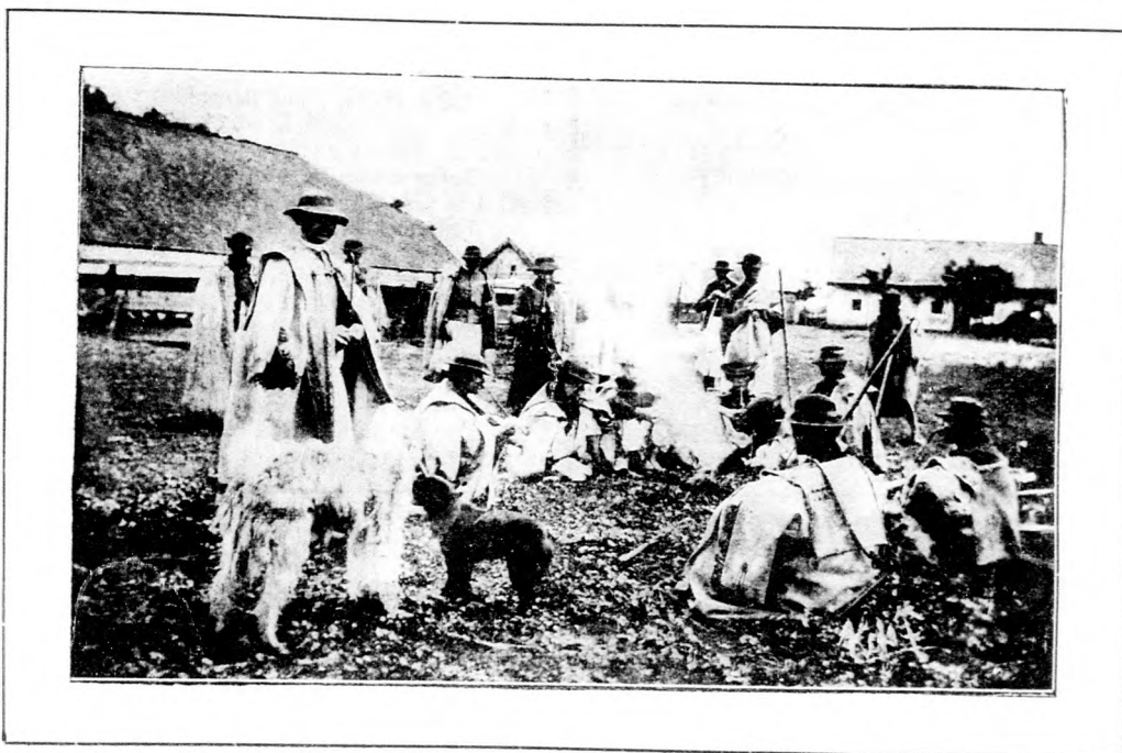
GULYÁSFŐZÉS AZ ALFÖLDÖN.

Csendesen nyugvó halottak, ti csak pihenjétek! mi imádkozunk érettetek és virágot hintve sirotokra, mécesot gyujtunk a ti emléknapotokon halottak napján.