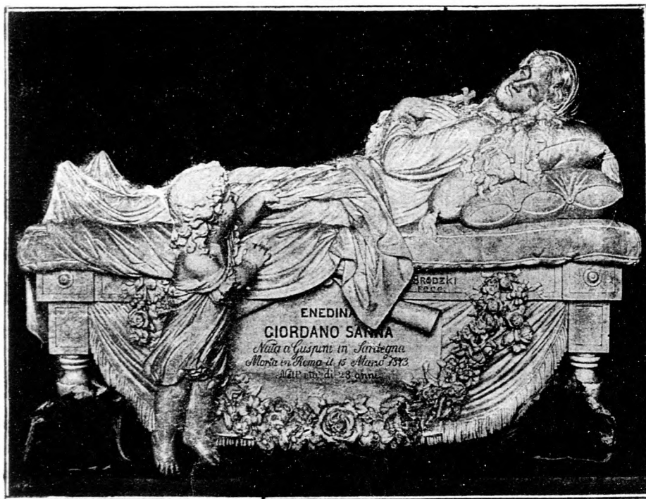
„KELJ FEL, ÉDES MAMA!”

Hogy a császár, néhány spekuláns és liferáns gazdagabb legyen... Megölték a fiamat. Nem az ellenség, ki ellen harczba vitték, megölték azok, akikkel együtt küzdött a császár parancsára. Mi lesz most velem? Ki gondoskodik rólam, ha egészen kidülök a munkaasztal mellől? Ki adja vissza gyermekeimet? Ki bünhődik az ártatlanul kiontott véért? Ha egy csirkémet megöli valaki, pörbe foghatom, aki a fiamat megölette, az nem bünhődik?... Ha nem tudod, mit jelent az, mikor egy családnak a szemefényét, gyermekét elragadják, küld el egy fiadat a csatába, s ha nem tudod, mi az: csatában lenni, menj el magad is Kinába, állj be a csatasorba. Különben is égbekiáltó bűn, hogy a vágóhidra küldesz a magad érdekében sok ezer katonát s míg azok elvérzenek és boldogtalanlanná teszik hátrahagyott családjukat, te magad itthon maradsz és szónokolsz és ünnepeleted magadat.