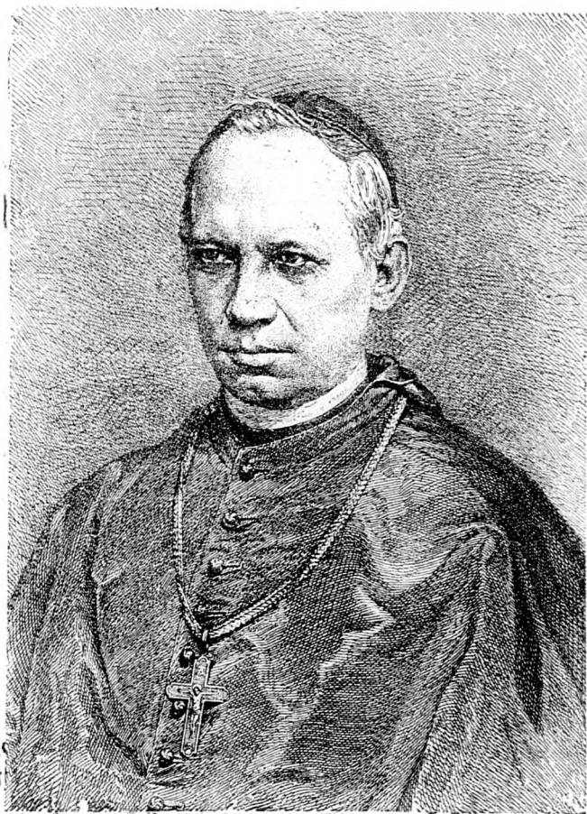
ZALKA JÁNOS. (1820—1901. †)

A politikával nem szeretett foglalkozni, de mint főrendiházi tag megfelelt törvényhozási feladatainak. Legfőbb gondja azonban mindenkor az egyházának ügye volt; iskolákat, templomokat épített, szegényebb jövedelmű papokat segített, papjai részére nyugdíjat rendelt. Lelkipásztori buzgóságát mutatja az is, hogy körutjain közel kétszáz ezer hívőnek adta föl a bérálás szentségét s mintegy 400 papot szentelt fel. Püspöki székfoglalójának 25-dik év-