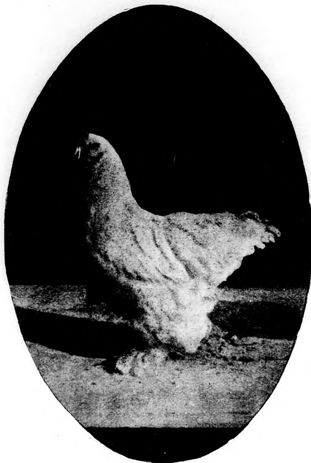
A Bráhma tyuk.

Míthogy a Bráhma tyuk nagy testű, zömök, egész alakja széles és mély, hustermelésre nagyon kifizeti magát a tenyésztése. Egy 1½ éves kakas pl. leölve 5250 gramm szokott lenni, a miből levonva a