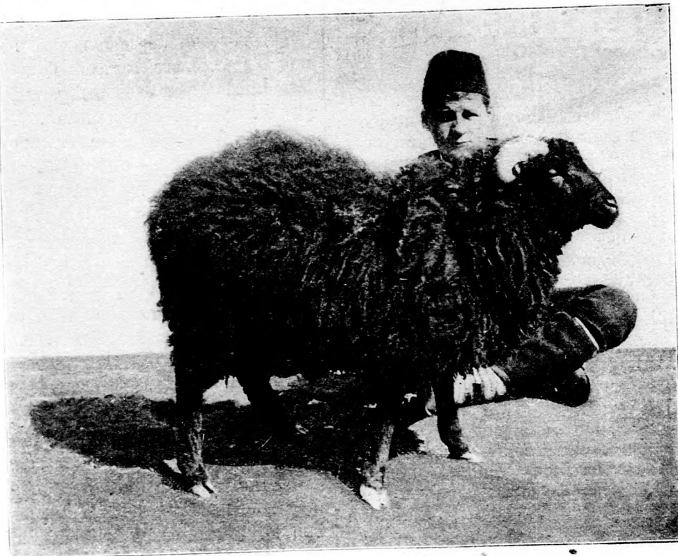
A Z A S Z T R A K Á N J U H .

sőt néhol hó is van; ha méheink kirepülnek, különben is a folytonos bentüléstől elgyengültek lévén, lehullanak és ott vesznek. Nehogy ezáltal sok méhünk elpusztuljon, okvetlenül szükséges, hogy a méhes elébe szalmát hintsünk. A szalmára lehullott méhek ott felmelegszenek és felrepülvén, a kasukba vissz-