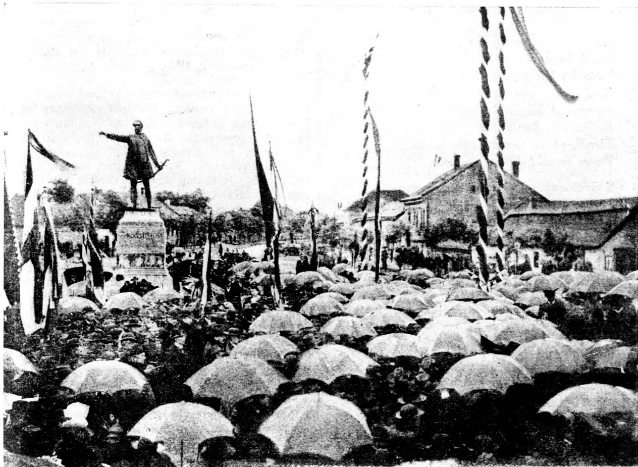
A hajdunánási Kossuth-szobor leleplezése.

Kuroki japán vezér megkerülő mozdulatokat tesz, éppen mint a véres liaojangi csata előtt s így a nagyobb csata el sem maradhat egy hét alatt.