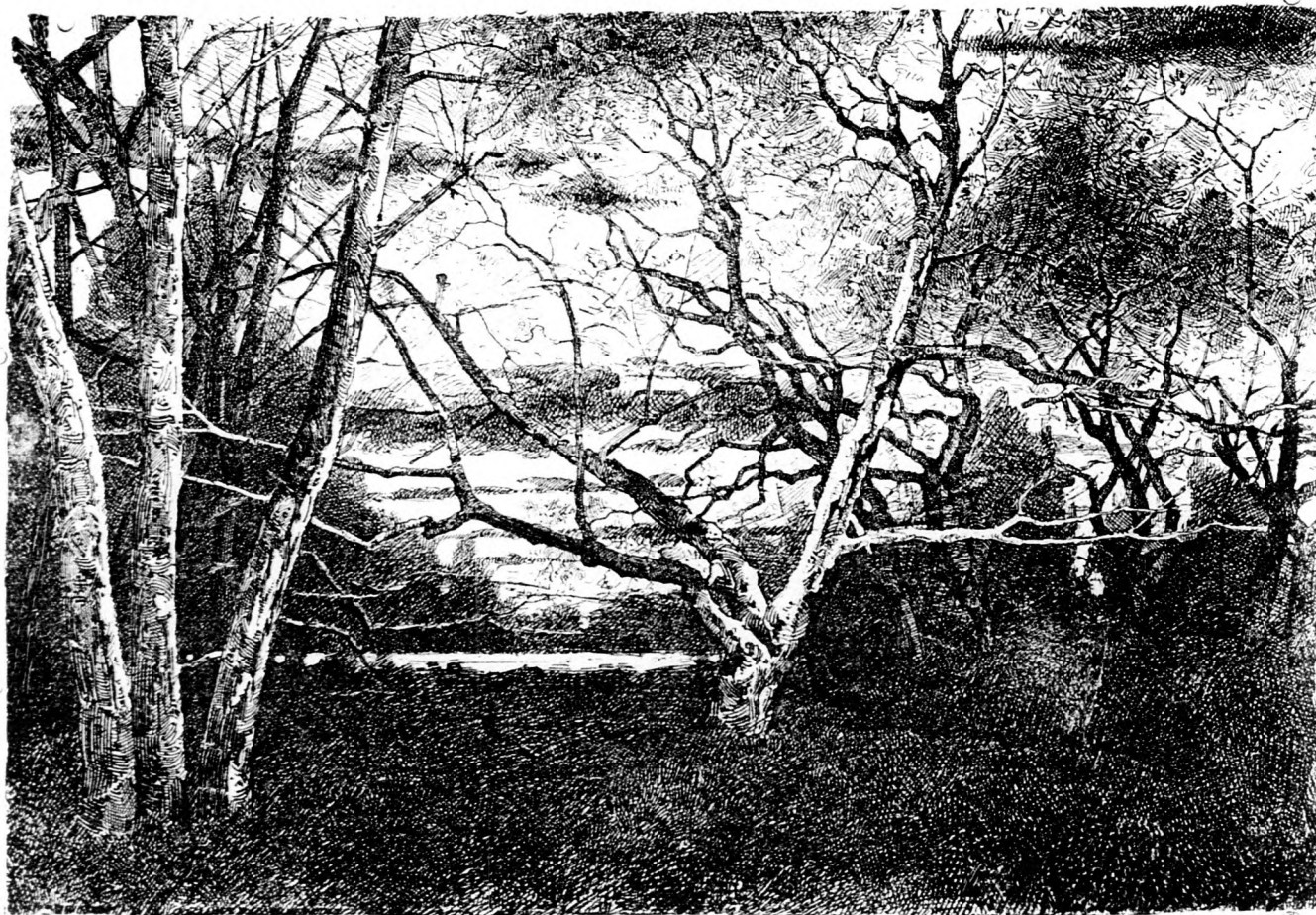
Ősz a fák között.

Az így kikészített tőzegalom nagyobb távolságokra [is] szállítható és waggonszámra szállítva