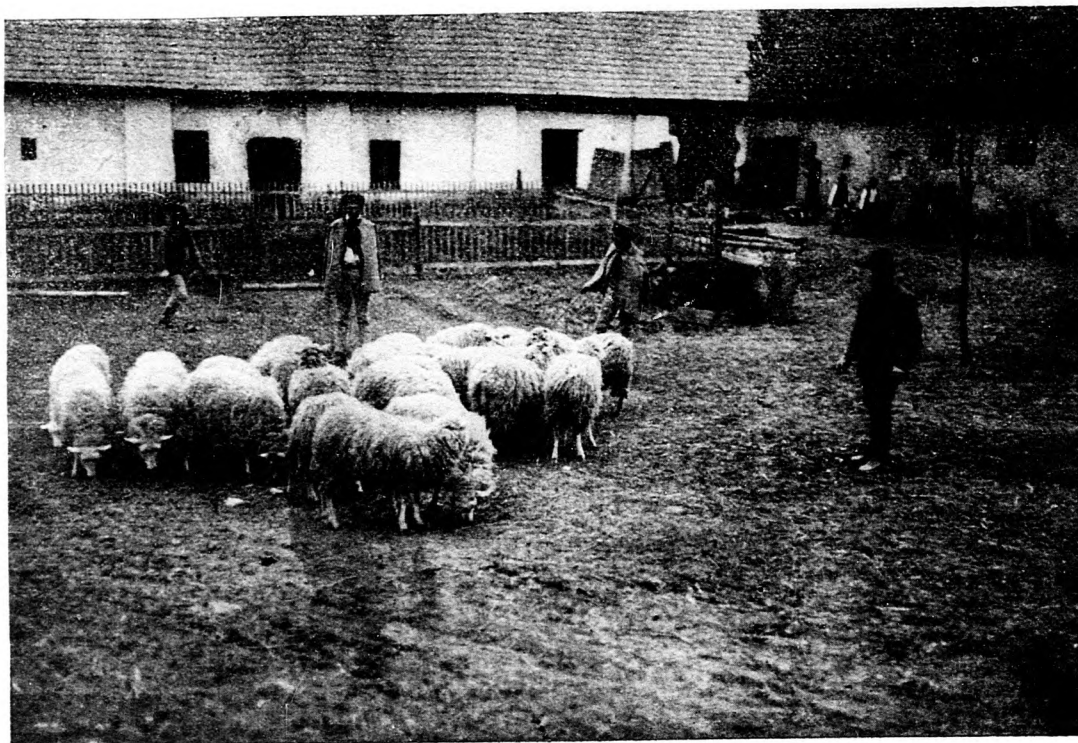
Szepes-Haraszti. Legelő-félvérek (friz-racka +).

A „Független Ujság“ eddigi irányából mindenki meggyőződhetett arról, hogy a lap megalapításakor