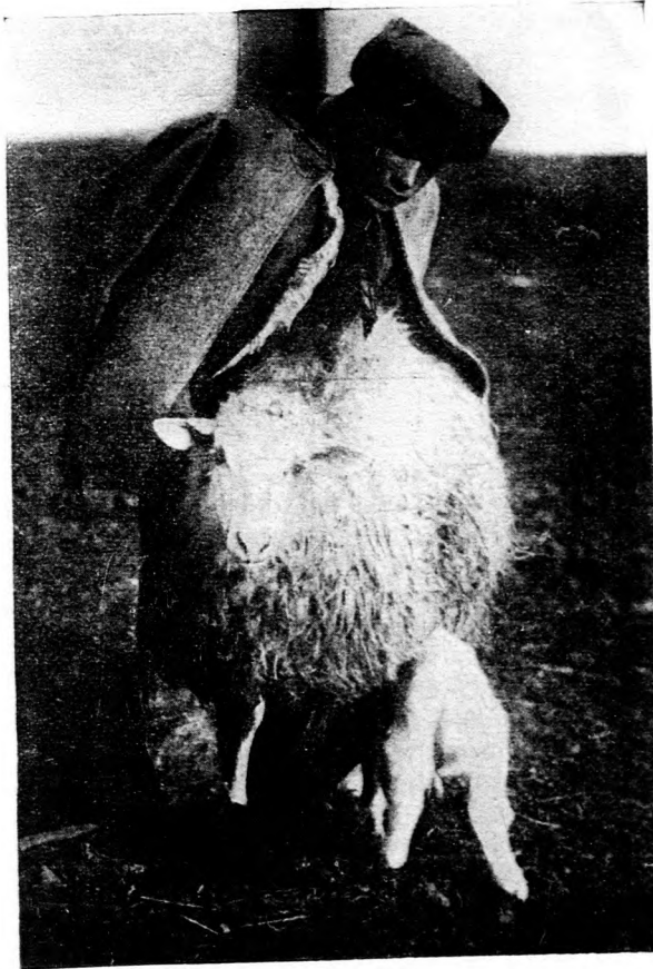
Báránját nem vállaló anya szoptatása.

Baromfikiállítás Bukarestben. A Baromfitenyésztők Országos Egyesülete (Budapest, IX., Üllői-ut 25.) a Bukarestben f. évi június hó 1-én kezdődő és négy óra terjedő általános kiállításon, egy állandó csoportos