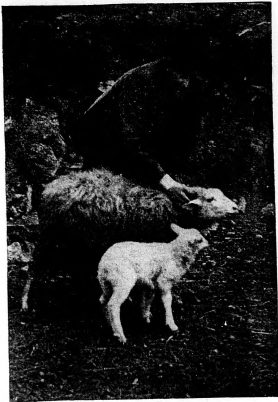
1 éves félvér anya 14 napos báránnyal.

A likőrök legnagyobb része mesterséges uton készül; azoknak ízét és zamatját gyári uton előállított esszenciák és növényi kivonatok segítségével adják