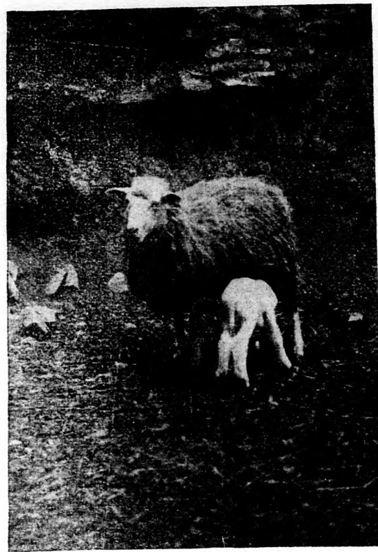
1 éves félvér anya 8 napos báránnyal.

fenntartása által tesz kiváló szolgálatot, tejével, illetve az ebből készült sajttal, bárányával s kisebb értékű gyapjával oly jövedelmet hoz, mely miatt