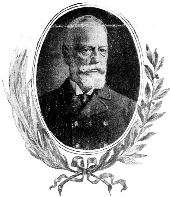
Károlyi Sándor gróf 1831—1906.

Károlyi Sándor gróf 1831 november 10-én született, mint Károlyi István gróf ifjabb fia. Az 1848—49-iki szabadságharc kitörésekor az atya által alakított Károlyi-huszárezredbe lépett s előbb mint hadnagy, később mint főhadnagy küzdött Klapka alatt. A szabadságharc vérbefojtása után Párisba menekült. Az általános amnesztia után hazajött és gazdasági működésre fordította idejét. Mikor az Országos Gazdasági Egyesület működése mind szélesebb körre terjedt ki, annak működésében tevékeny részt kezdett venni s ebben csakhamar ki is tűnt. Első nagyobb szereplése a gazdaközönség előtt 1879-re,