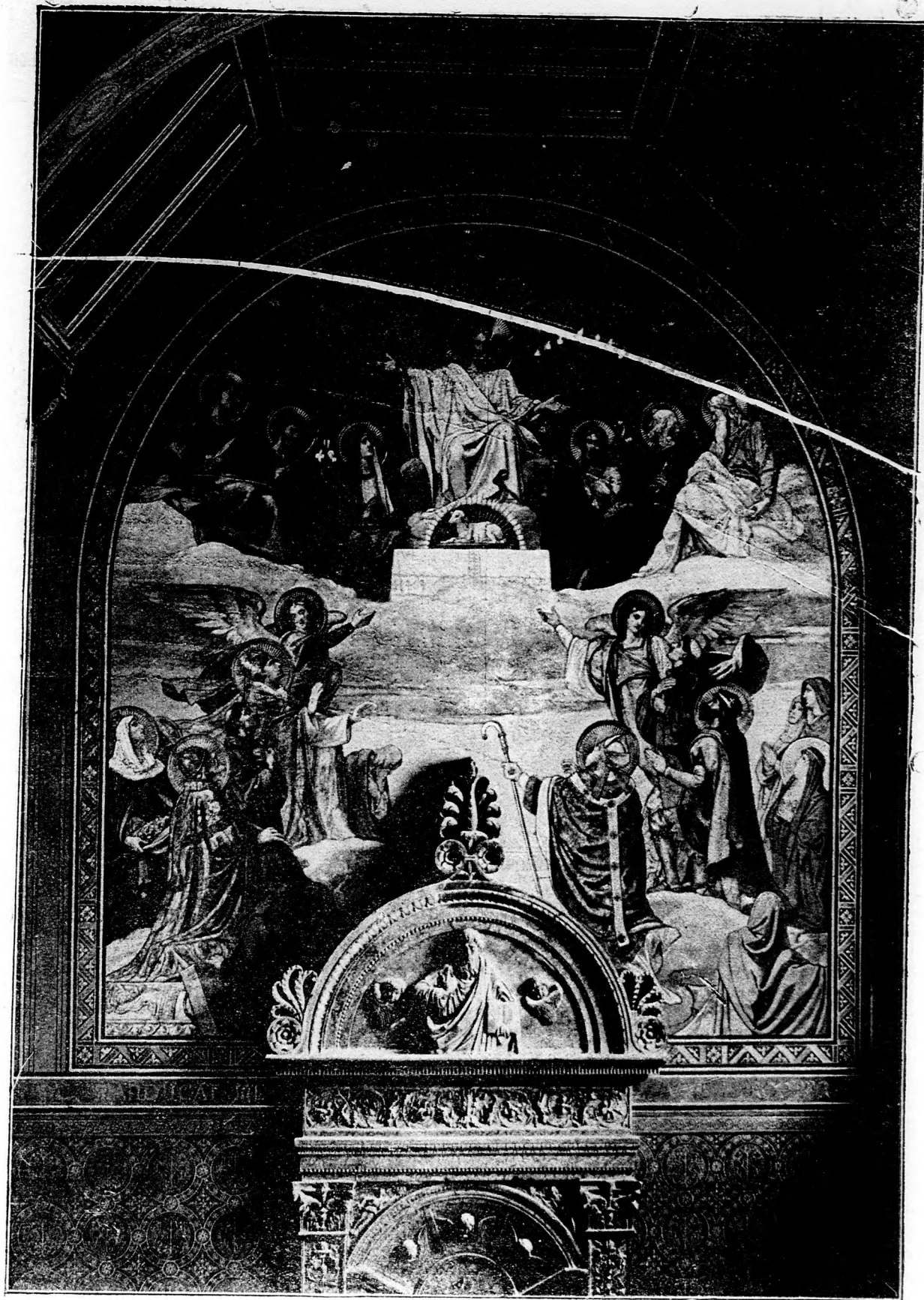
A pécsi székesegyház oltárképe.