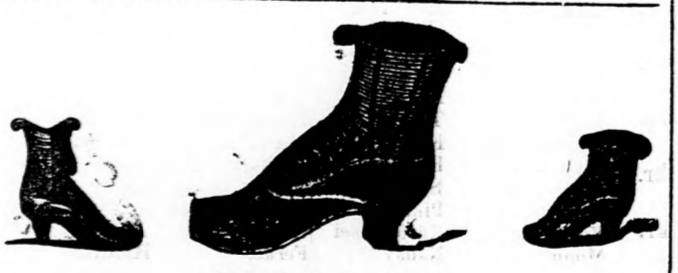
Olcso és tartós!