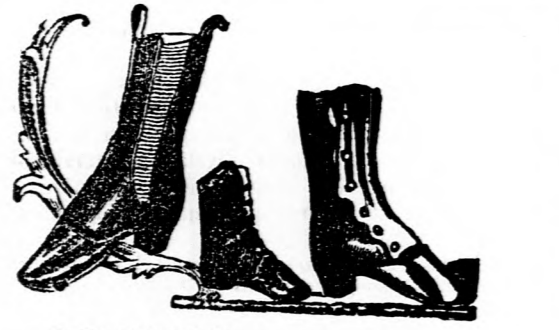
Oleós és tartós!

Árjegyzékek, úgy ezekről, valamint a világhírű Robey-féle gőzgépekről és a szabadalmazott vaskerekű cséplőgépekről kívánatra ingyen küldetnek.