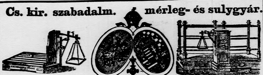
Barom-mérleg. Tízdes mérleg kettős vonórúddal. Nagy raktár mindennemű mérlegekből a legteljesebbtel szilárd kivitelben.

Florenz J. cs. kir. udvari szállító Bécs: Fiók I. Operngasse 4. Budapest: utca 4-dik sz.