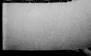
Small caption text.

Erre pedig megint visszaröplött a föld felé és néhány perc alatt a világtörténelem egész századi mentek el szemek előtt.