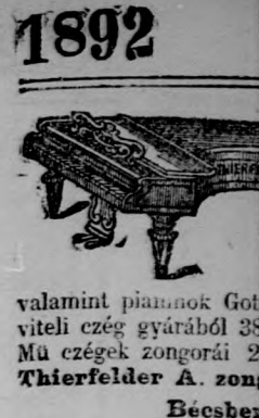
valamint piáncok... szab. elektro-met...