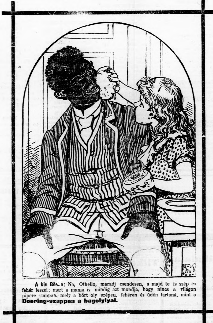
A kis Bös. a: Na, Othello, maradj csendesen, s majd te is szép és fehér leszel; mert a mama is mindig azt mondja, hogy nincs a világon piperé szappan, mely a bőrt oly szépen, fehéren és üdén tartaná, mint a Doering-szappan a bagolylyal.

Nélkülözhetetlen ér- zékeny bőrű egyének- nek.