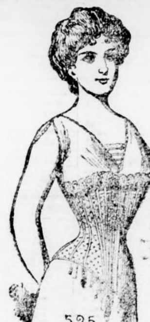
525 Lilla 525 4.40 kor.