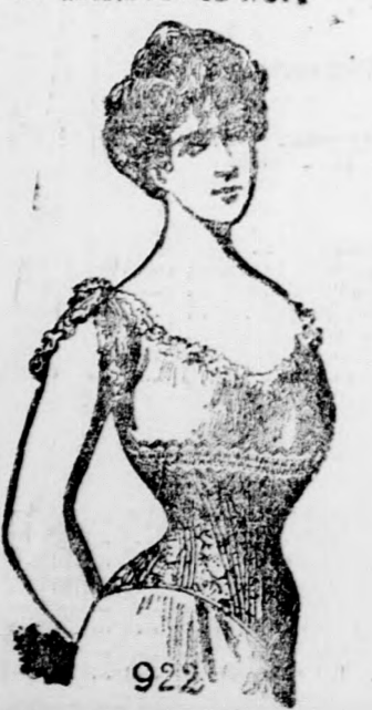
922 Vilma 922 6.40 kor.