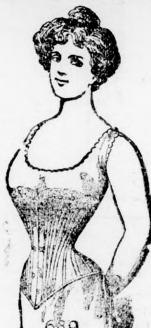
689 Szabolcsi 689 6.80 kor.