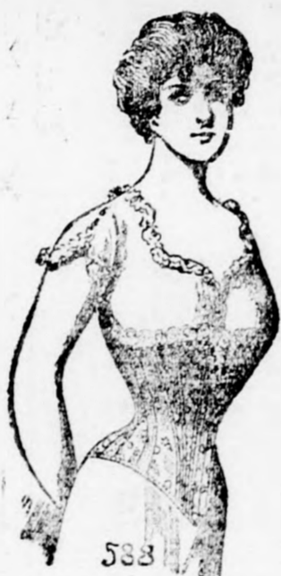
588 Breda 588 2.50 kor.