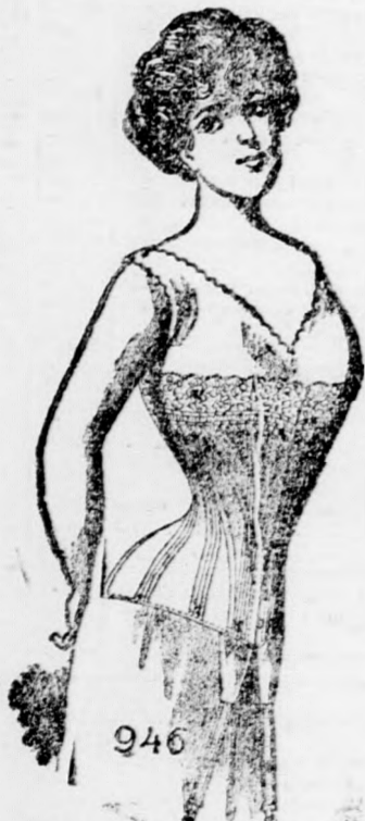
946 Fria Lucia 946 13 kor.