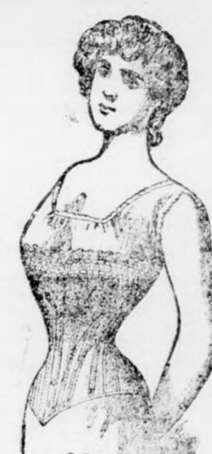
696 Lyon 696 12 kor.