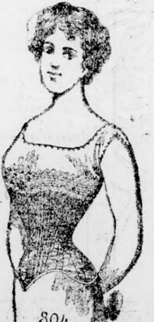
804 Mária 804 10 kor.