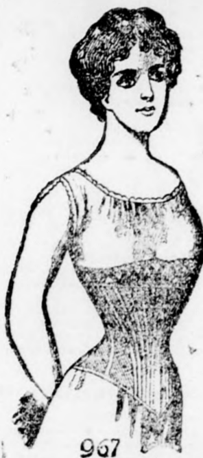
967 Katica 967 3.60 kor.