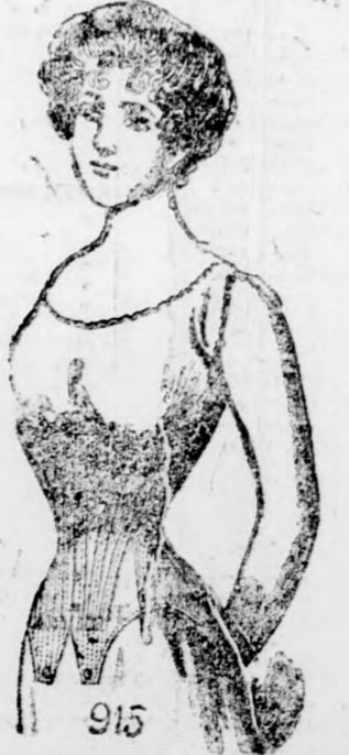
915 Margitta 915 9 kor.