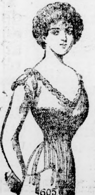
605 Straight-Point 605 10 kor.