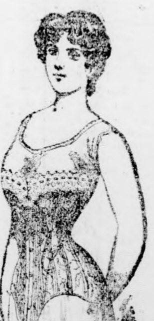
460 Budapest 460 20 kor.