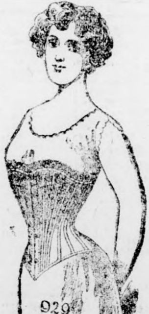
929 Mária 929 4.80 kor.