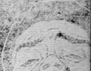
Minden gy... kezdődő bar...

Chicago. — Zariat. nov. 11. nov. 10. Buza decz-re . . . . . 89.12 85.63 Buza máj-ra . . . . . 88.8 88.12 Tengeri decz-re . . . . . 44.75 44.75