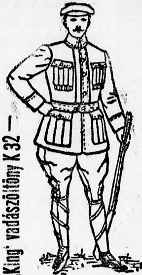
„King” vadászöltöny K 32

világhírű angol vízmentes, könnyű és porózus szövetből készült