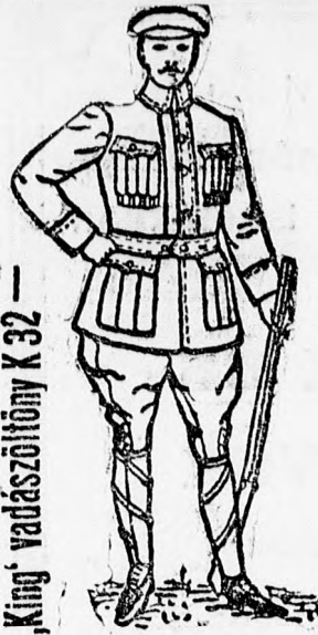
„King“ vadászöltöny K 32