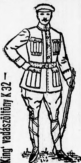
"King" vadászöltöny K 32

Budapest, IV., Koronaheczeg-u, 2. Az országban mindenütt kapható.