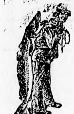
Az Emulsió vásá- rlásánál a SCOTT- féle módosított véd- jegyű — a halász- kértünk figye- lembe vennél.

bármily makacs és hosszadal- mas is legyen az, a SCOTT- féle Emulsió gyorsan megszün- tet. Még a sorvadásos betegek- nek is könnyebbülést szerez a SCOTT-féle Emulsió, feltéve, hogy idejekorán használják, mely esetben állandó, tartós gyógyulást eredményez.