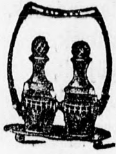
4057 Argentor ezüst K. 20.—