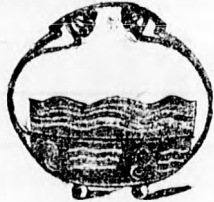
3786 Argentor ezüst K. 23.—