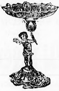
3850 Argentor ezüst K. 23.—