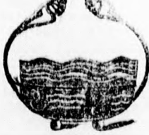
3706 Argentor ezüst K. 23.—