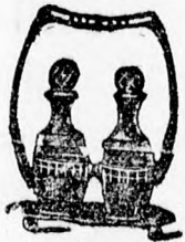
4057 Argentor ezüst K. 20.—