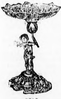
3850 Argentor ezüst K. 23.—