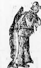
Az Emulsio vásár-lásánál a SCOTT-féle módszer véd-jegyéül — a halaszt — kérjük figye-lembe venni!

oly jóízű és édes, hogy a gyermekek örömmel, előszeretettel veszik; szabályozza az emésztést, csillapítja az idegeket, miáltal a szülőknek, valamint a gyermekeknek nyugodalmas, háborítatlan éjszakákat biztosít.