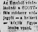
Az Emulsió vásárlásánál a SCOTT-féle módszer védjegyét — a halászt — közzük figyelmeztetésül.

specifikus megbízható szer mindennemű tüdőbaj ellen és nemcsak biztos szer, hanem a legolcsóbb is. Nagyfokú táperéje annak tulajdonítható, hogy előállításához a legfinomabb, a legtisztább és leghatásosabb anyagokat veszik, melyek egyáltalán beszerezhetők, továbbá azon tulajdonságának, hogy az eredeti felülmulhatatlan SCOTT-féle előállítási mód folytán nemcsak izletes, hanem rendkívül könnyen emészthető is.