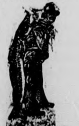
Az eredeti vásárlásnál a SCOTT-féle emulsió valóban feltűnő gyorsan izmosítja a gyermeket, erősíti a csontokat és elősegíti fejlődésüket.

feltűnő gyorsan izmosítja a gyermeket, erősíti a csontokat és elősegíti fejlődésüket. Ez a rendkívüli hatás valóban csak ilyen kiváló szerrel érhető el. A SCOTT csakis elsőrendű alkatrészeket tartalmaz s az eredeti SCOTT-féle eljárás okozza hogy hatásában felülmulhatatlan és nemcsak fiatal és öreg ember, hanem még a halál küszöbén hitt gyermek is könnyen emészti.