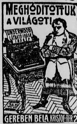
GEREBEN BELA KRISTOF ATER?

A csak lecsök-työdi. VALÓ. di francia különb-gességek (óvszer) csakis P. BERGUERANPILS legújabb páris gyárostól legelőny-sobben beszerezhetők Polgár Sándornál Budapest, VI. ker., Erzsébet-körut 50. Részletes képes ár-jegyzék ingyen és bérmentve.