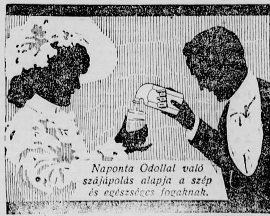
Naponta Odollal való szájápolás alapja a szép és egészséges fogaknak.

A szerb sertéskivétel. Amint a közös vámterületnek Szerbiával kötött kereskedelmi szerződése életbelépett, nyomban megindultak az előkészületek arra, hogy a szerb disznó- és marhahúvétel Magyarországon és Ausztriában visszahódítsa a vámháboru következtében elvesztett piacát. Így Bécsbe tegnap érkezett meg Szerbiából az első sertésszállítmány, amelyet a vágóhid részvénytársaság árusított. Két vagonban nyolczvanhat darab sertés került piacra, de csak hatvanöt darab jutott eladásra, mert huszonegy sertést az egészségügyi hatóság kizárt a forgalomból, mivel az állatok utközben gondatlan szállítás miatt (?) elhullottak. A hízalt sertések elég jó minőségűek és pórával 260—280 kilogrammosak, minőség tekintetében nem érnek fel a magyar hizott sertésekkel. A piacon kevés érdeklődés mutatkozott a szerb sertések iránt s délután 1 órakor a hatvanöt darabból mindössze negyven kelt el 120—124 koronán száz kilogrammonként. A szerb sertéshez behozatala attól függ, vajjon a belgrádi exportörök meg fogják-e találni számadásukat. Ez idő szerint a szerbiai behozatalra nézve az árak kedvezők, de csak sertéshus tekintetében, marhahúsra nézve az import a szerb kereskedőknek nem előnyös s valószínűleg még hosszú időbe fog telni, míg az áralakulás kedvezni fog a szerb marhahúvételnek.