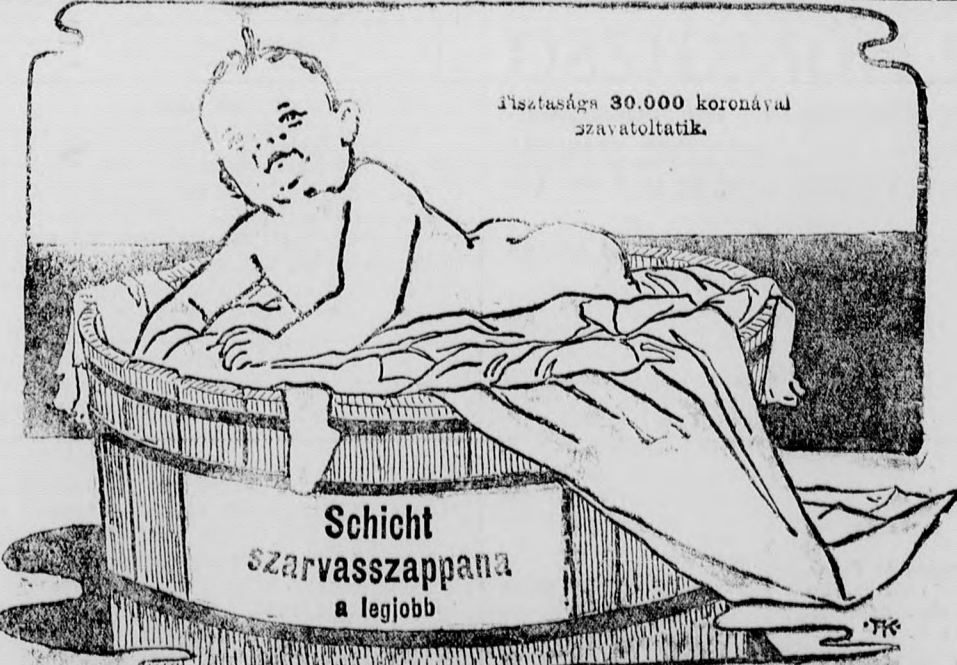
Schicht szarvas jegyű szappánát rendkívül, kitűnő tulajdonságainál fogva előnyösen használhatjuk minden elgondolható mosási célra: személyes használatra, legfinomabb és durva, fehér és színes vászonnemtek mosására, konyhaedények, bútorok, szőnyegek, háziállatok tisztítására stb. stb. A legjobb kiválasztott nyersanyagokból lesz előállítva