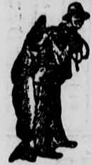
Az Emulsióvásár Asznál a SCOTT féle módszer véd jegyét — a ha- lászát — kérjük egyetemesen!

amely nem bírja el a közönséges csukamájolajat, a