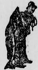
Az Emulsió készítésénél a SCOTT-féle módszer védjegye — a halast — kérjük ügyelemben venn!

Ezren és ezren tapasztalták ezt az utolsó 32 éven keresztül. Ép ily szembeötlő a javulás az általános egészséget illetően.