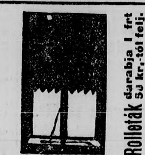
Rollétek darabja 1 ftt 53 kr.-tól felj.