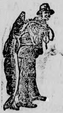
Az Emulsió készítésénél a SCOTT-féle módszer védelmét — a halászt jegyzet — kérjük figyelembe venni.

által. Néhány kevés adag teljes megelégedésére fogja ezt Önnek is bebizonyítani.