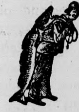
As Emulsió vásárlásánál a SCOTT-féle módszer védjegyét a halaszt kerjük egyelőre szemlélve venni.

Egy eredeti üveg ára 2 K 50 fillér. Kapható minden gyógytárban.