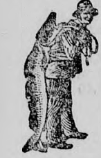
Az Emulsióvásárlásánál a SCOTT-féle módszer védjegyét — a halászt — kerjük figyelembe venni.

Egy eredeti üveg ára 2 K 50 fillér. Kapható minden gyógyszerárban.