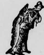
Az Emulsió vásárlásánál a SCOTT-féle módszer védjegyét — a halaszt — kérjük figyelembe venni.

Egy eredeti üveg ára 2 K 50 fillér. Kapható minden gyógyszerárban.