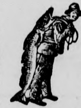
Asz Emulsió vásárlásánál a SCOTT-féle módszer védjegyét — a halaszt — kerjük figyelembe venni.

Egy eredeti üveg ára 2 K 50 fillér. Kapható minden gyógytárban.