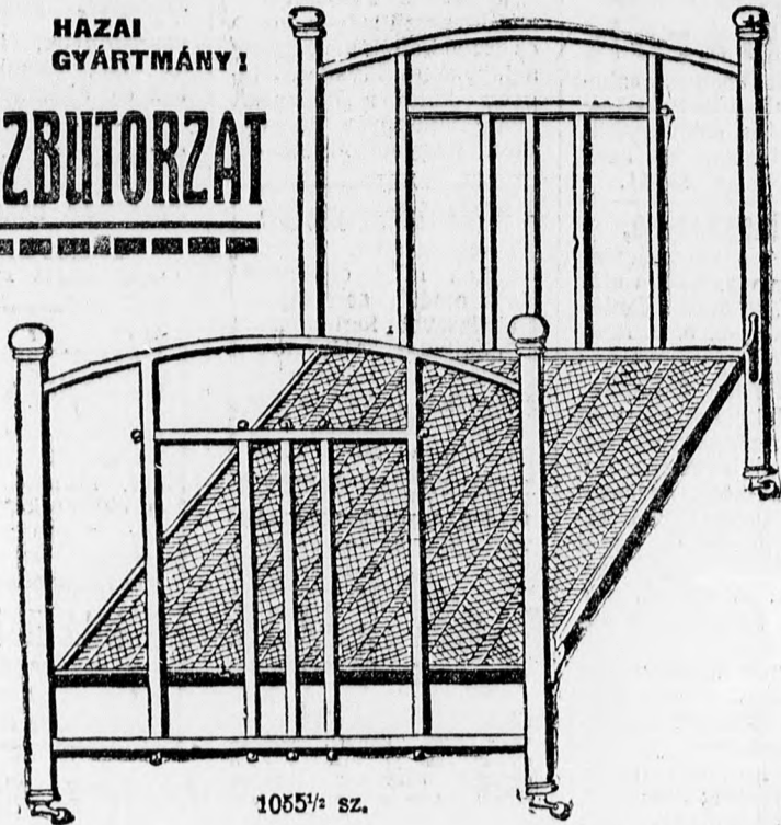
1055 1 / 2 sz.

Előrendű hazai gyártmány kiváló minőségű anyagból, vernirozva, úgy, hogy fenyvezést nem igényel s elegendő, ha száraz, puha ruhával naponta áttörlik.