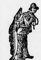
Az Emulsióvásárlásánál a SCOTT-féle módszer végigjárt — a halászt kérjük ügyelmebe venni.

Egy eredeti üveg ára 2 K 50 fillér. Kapható minden gyógytárban.