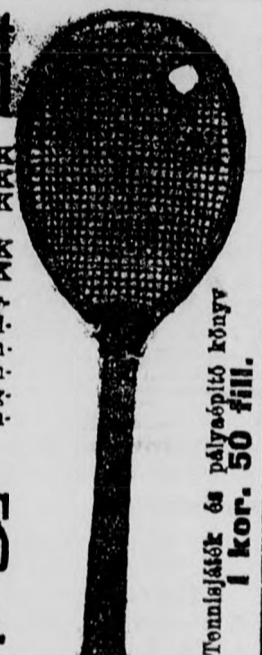
Tennisjáték és pályajelző könyv 1 kor. 50 fill.

Tennis-cikkekről, u. m. labda, presztáska, kerti és középháló oszlop játszma és pályajelzők, labdakosarak és Tennis öltözködésről stb. sziveskedjék Tennis-árjegyekünket kérni. — Saját rakett javító-műhely a házban.