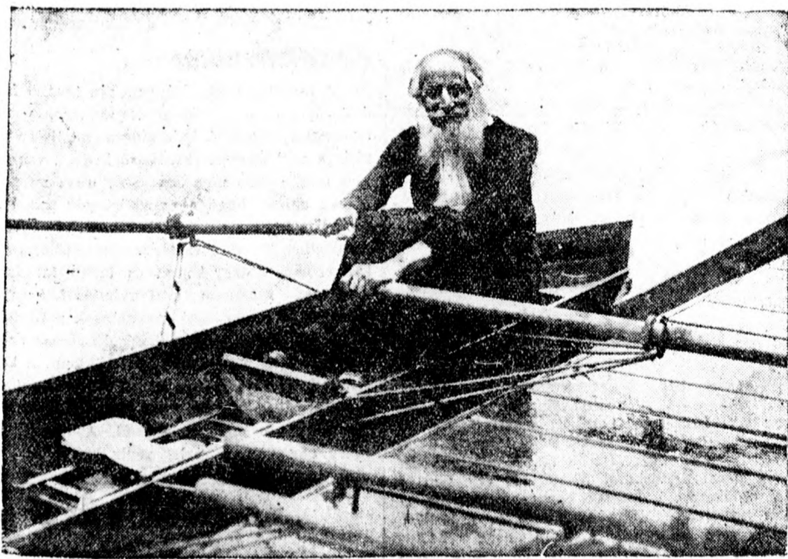
A világ legöregebb sportembere