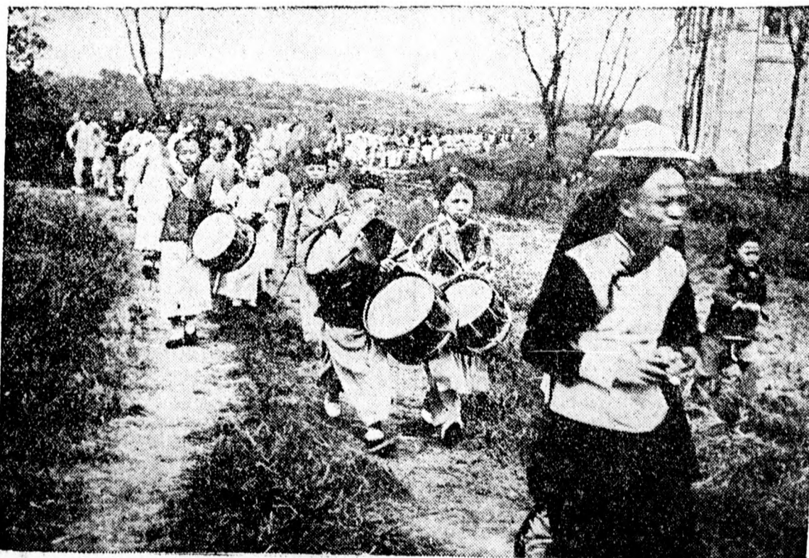
Japán nemzeti ünnep

NAPIREND. Naptár. Szombat, szeptember 13. Róm. kath.: Amál pk. hv. — Prof.: Mandula. — Görög-ország: augusztus 31. B. assz. öve. — Zsidó: Elul 11. — A nap két reggel 5 óra 34 perczkor, nyugszik este 6 óra 17 perczkor. — A hold két délután 5 óra 46 perczkor, nyugszik reggel 8 óra 1 perczkor. — A miniszterek nem fogadnak. — Nyitvalevő muzeumok: Nemzeti Muzeum ásványtára 9—2-ig, Aquinumi Muzeum 9—4-ig, Erzsébet Muzeum 9—12-ig és 3—4-ig, Iparművészeti Muzeum 9—1-ig, Mezőgazdasági Muzeum 10—1-ig, Ráth Muzeum (Városligeti fasor) 10—4-ig, Széchenyi Muzeum 10—12-ig, M. kir. Kereskedelmi Muzeum külkereskedelmi hírszolgálat és közszállítási osztály 9—2-ig, vám- és tarifaosztály 3—8-ig, nyilvános szakkönyvtár 9—2-ig. — Nyitvalevő könyvtárak: Egyetemi Könyvtár 9—8-ig, Nemzeti Muzeum Könyvtára 9—4-ig, Pedagógiai Könyvtár 3—7-ig, Statisztikai Könyvtár 10—1-ig. — Nyitvalevő képtárak: Őszi kiállítás a Nemzeti Szalonban, nyitva 9—6-ig. Belépődíj 1 korona. Állandó kiállítás a Könyves Kálmán művészeti szalonjában (Nagymező-utca 37—39.), nyitva egész nap. A Szépművészeti Muzeum modern képtára, nyitva 10—2-ig. A gróf Pálffy-gyűjtemény a Szépművészeti Muzeumban, nyitva 10—2-ig. Belépődíj nincsen.