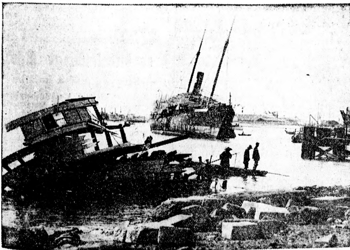
A taifun pusztításai

Pétervárról jelentik: Nesterov , az orosz katonai aviatikusok legmerészebb tiszt-pilótája, nagyon megjárta. Néhány nap előtt ugyanolyan bravuros és nyaktörős produkciót végzet repülőgépén, mint a francia Pegoud és ezért felesleges hatósága 30 napi szabáristommal büntette, mert hiábavalóan kockáztatta életét.