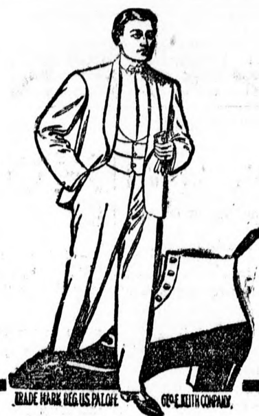
TRADE MARK REG. U.S. PAT. OFF. G. E. MUTH COMPANY.

Államilag diplomált tanárok. Prosp. kívánatra ingyen