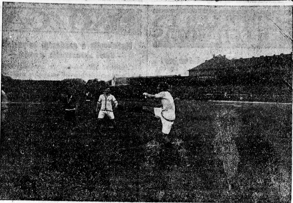
Az FTC-Rapid football mérkőzése

( ) A Ferencvárosi Torna Club evezős osztálya folyó hó 21-én vasárnap délelőtt tartotta az évi házi versenyét a klubtagok és a társ egyesületek élénk érdeklődése mellett. Nagyban emelte a verseny érdekességét az annak keretében lebonyolított