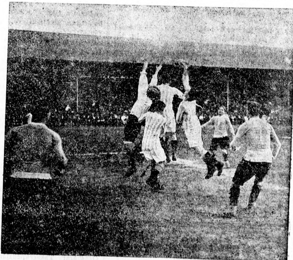
Erdekes jelenetek a vasárnapi mérkőzésről, amely 6:4-el végződött a magyar színek javára