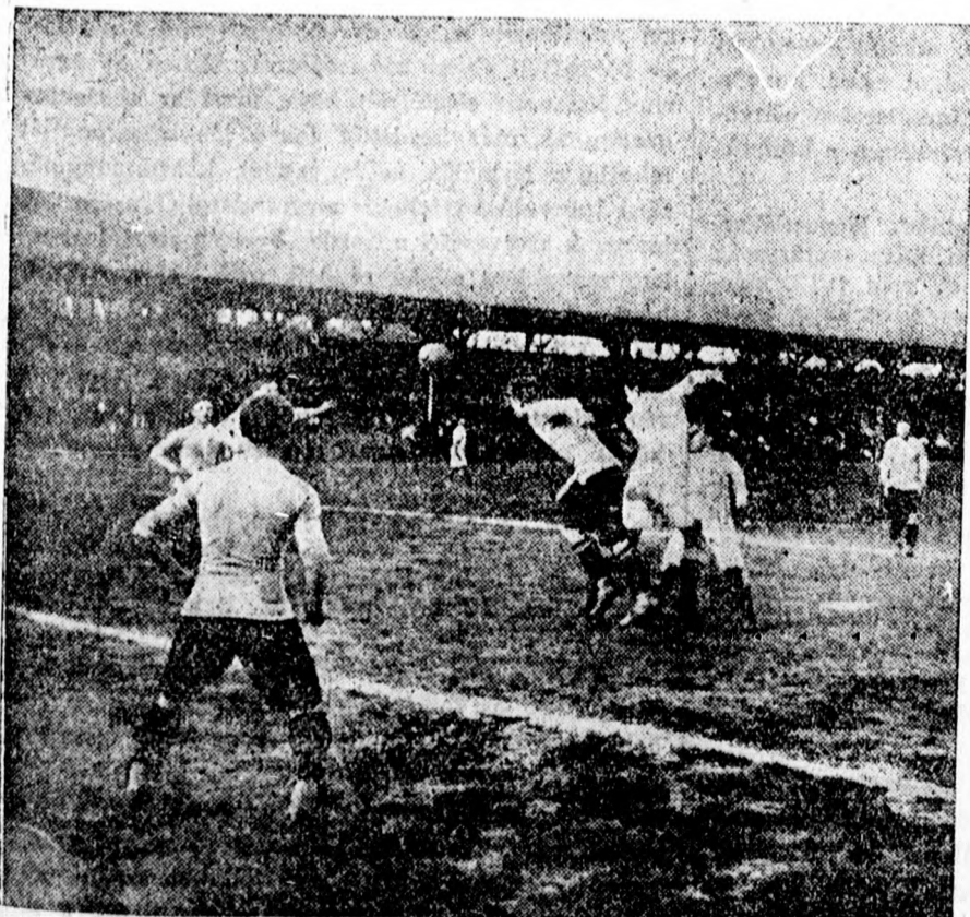
Az FTC-Rapid mérkőzés