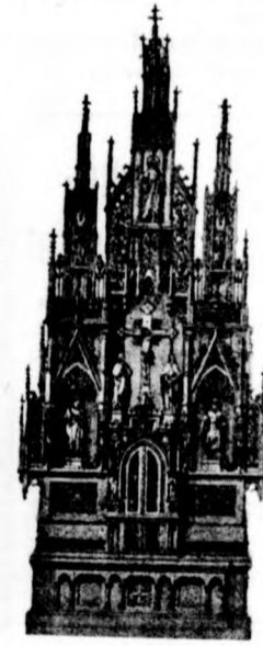
Németprónal templom főoltára 1907.

Oltárok, szószékek, keresztelő-kutak, szobrok és kereszt-úti állomások stb. izléses készítése.