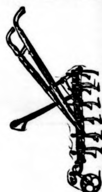
Újabb gép- és aratógép-rajzok a McCormick gyártmányokból.