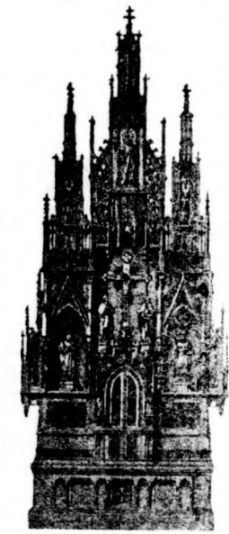
Németprónai templom főoltára 1907.